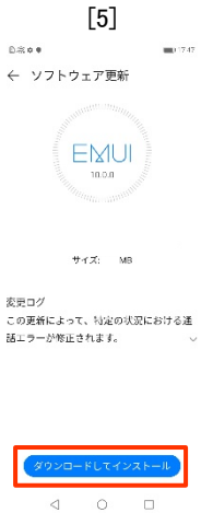
[ダウンロードして インストール] タップします。