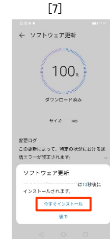
[今すぐインスト ール]をタップします。