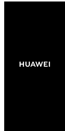
アップデートが開始され、 再起動後に更新が完了します